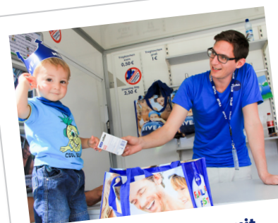
Freude am Umgang mit Zuschauern und Kindern!