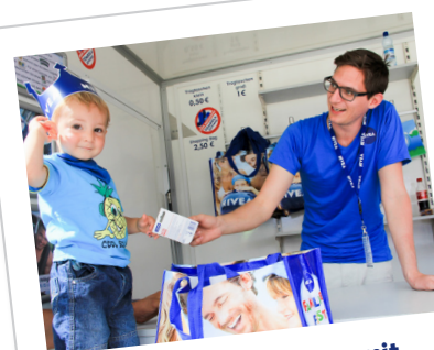
Freude am Umgang mit Zuschauern und Kindern!