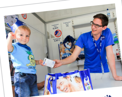
Freude am Umgang mit Zuschauern und Kindern!